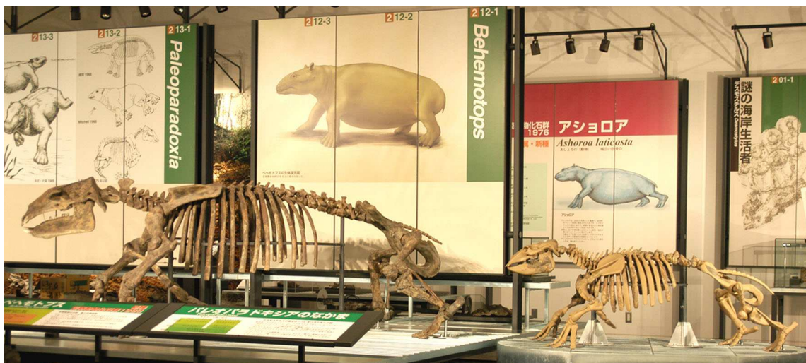
アショロア（右）とベヘモトプス

これらの研究結果は、「足寄動物化石博物館紀要」第1号と第4号に掲載されています。