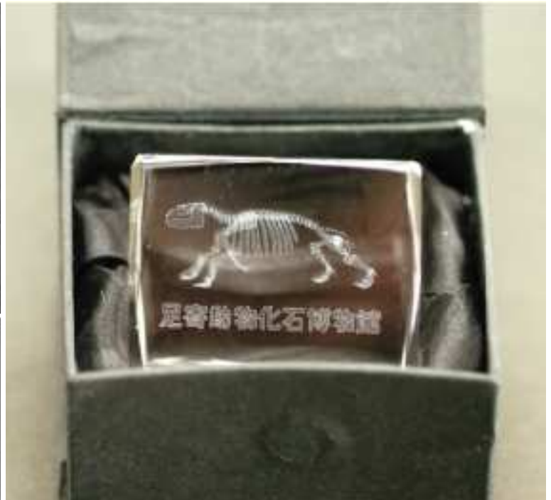
クリスタルブロックの文鎮（上）と キーホルダー（下）