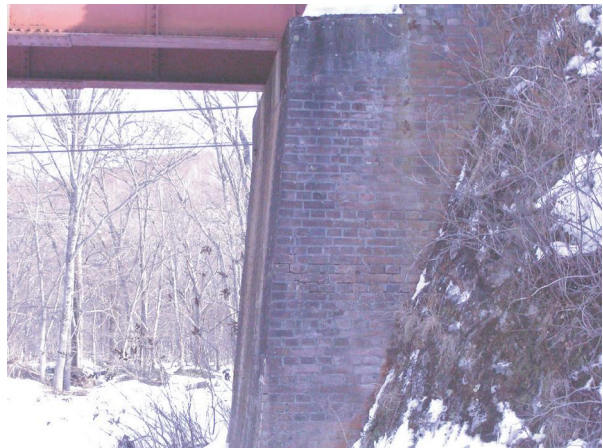
利別川第9橋梁の煉瓦造りの橋台