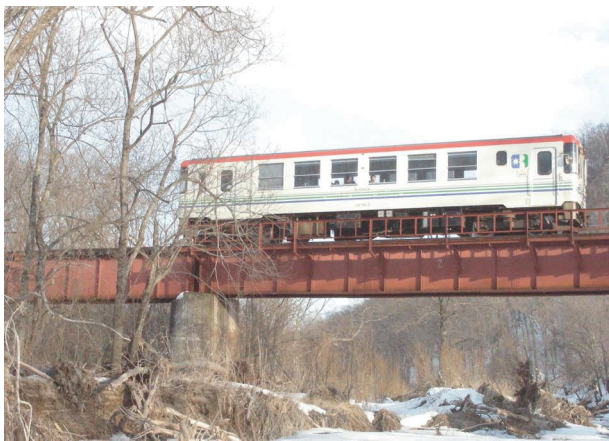
利別川第10橋梁と銀河線車両

足寄町の近代化をもたらした鉄道、それを支えた煉瓦。いっしょに見ることができるのもあとわずかとなりました。国道とほぼ併走するので、何カ所かでふるさと銀河線の車両と煉瓦の橋脚を同時に見ることができます。写真に残すのにいい場所もありそうですよ。