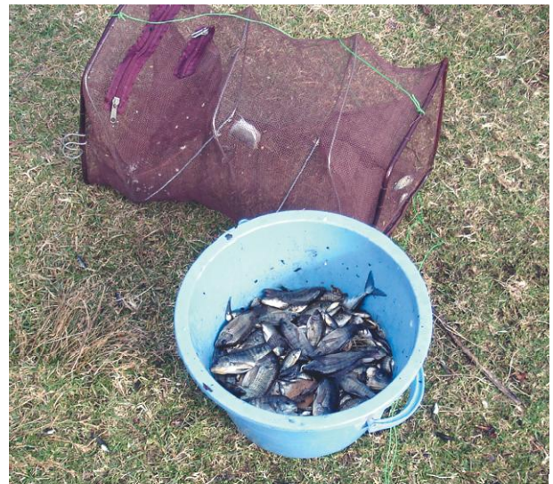
「どう」と捕獲した魚、11月10日

ティラピアの完全駆除はすぐには困難ですが、滝の下の池から広がらないためにも、個体数を少なく抑える。このことを長期方針として取り組んでいきます。