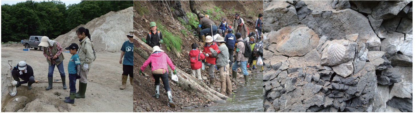
釧路市阿寒町での発掘のようす