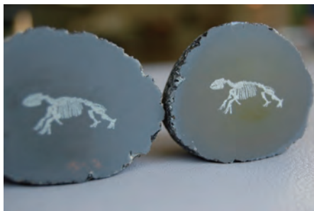
アショロアのレーザー彫刻入 十勝石みがき

現在、ミニ発掘のみとなっている館内での化石体験ですが、皆さまの要望に応え、人数・日時などを限定した上で、一部の化石体験を館内で実施します。詳細は館内の掲示や、博物館のウェブサイトでお知らせします。お楽しみに！