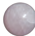
ローズクォーツ丸玉