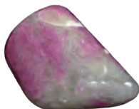
ルビーコーディエライト