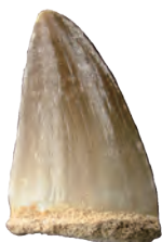
モササウルスの歯