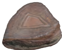
ストロマトライト