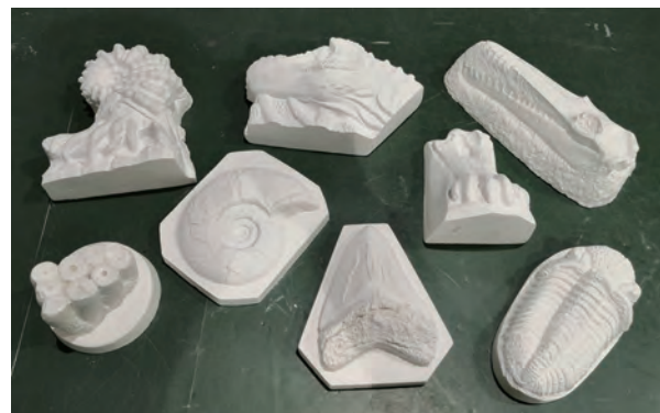
レプリカづくりや古生物模型づくりも！