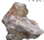
メリコイドンの 歯