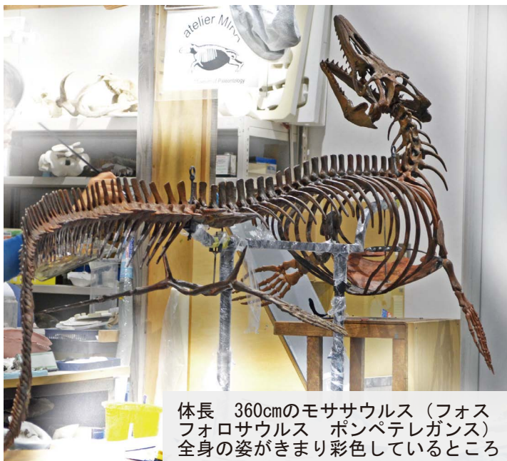
体長 360cmのモササウルス（フォス フォロサウルス ポンペレガンス） 全身の姿がきまり彩色しているところ

*モササウルス：白亜紀後期の7,900～6,600万年前に海にすんでいた肉食の海生爬虫類。オオトカゲに近い。日本では北海道や近畿地方で化石が見つかる。