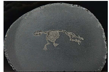
およぐアショロア入り十勝石

みがきたい石をお持ちいただいても けっこうです。石の種類・大きさ・磨 きかたによってその日に完成できない かも知れませんが、挑戦しましょう。