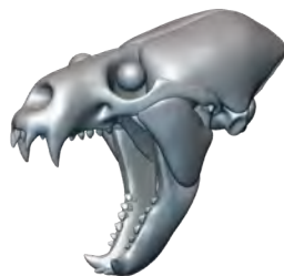
咀嚼筋と眼球の復元