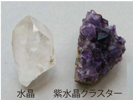
水晶 紫水晶クラスター