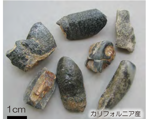
カリフォルニア産