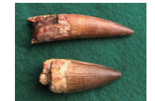
スピノサウルスの歯